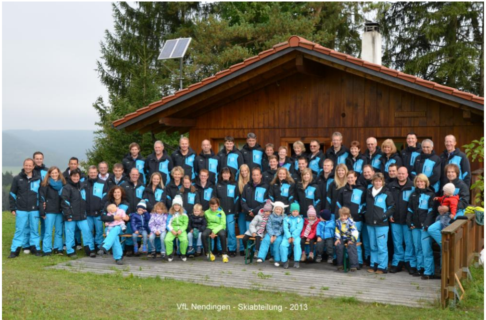
VfL Nendingen - Skiabteilung - 2013